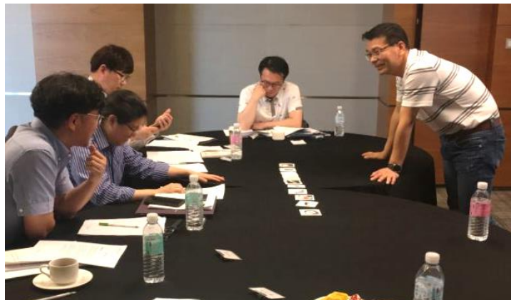
[갈등관리] 시나리오 토론 중

“ 바로 적용 가능한 좋은 TOOL과 실례를 통한 이해하기 쉬운 설명, 정말 좋았습니다.”